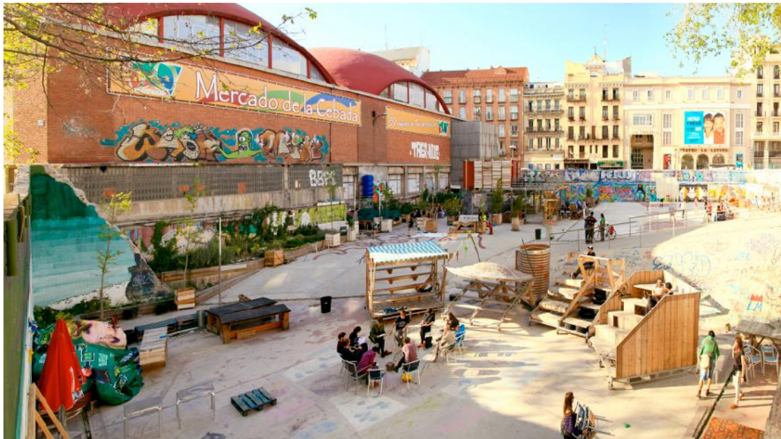
Imagen 3. Imagen general del Campo de la Cebada.

<<El Campo de Cebada es uno de esos lugares donde llevar a amigos y visitas cuando quieres enseñar cosas increíbles que pasan en la ciudad, que te hace sentir orgulloso como si fueses parte de ello porque El Campo de Cebada es en la medida en que los vecinos lo disfrutan, lo cuidan y lo hacen suyo. En "la Cebada" hay lugar para todos. Para los propios vecinos del barrio y para los que cruzan la ciudad entera solo para disfrutar de una tarde en compañía de amigos acomodados en los mobiliarios diseñados y fabricados en los ya famosos talleres que aquí se llevan a cabo, entretenidos viendo jugar al baloncesto en la pista central, viendo una función teatral desde las gradas o arreglando los huertos. La Cebada es uno de esos escasos logros urbanos que consigue que te sientas parte de un equipo, de un lugar y de un momento.>>