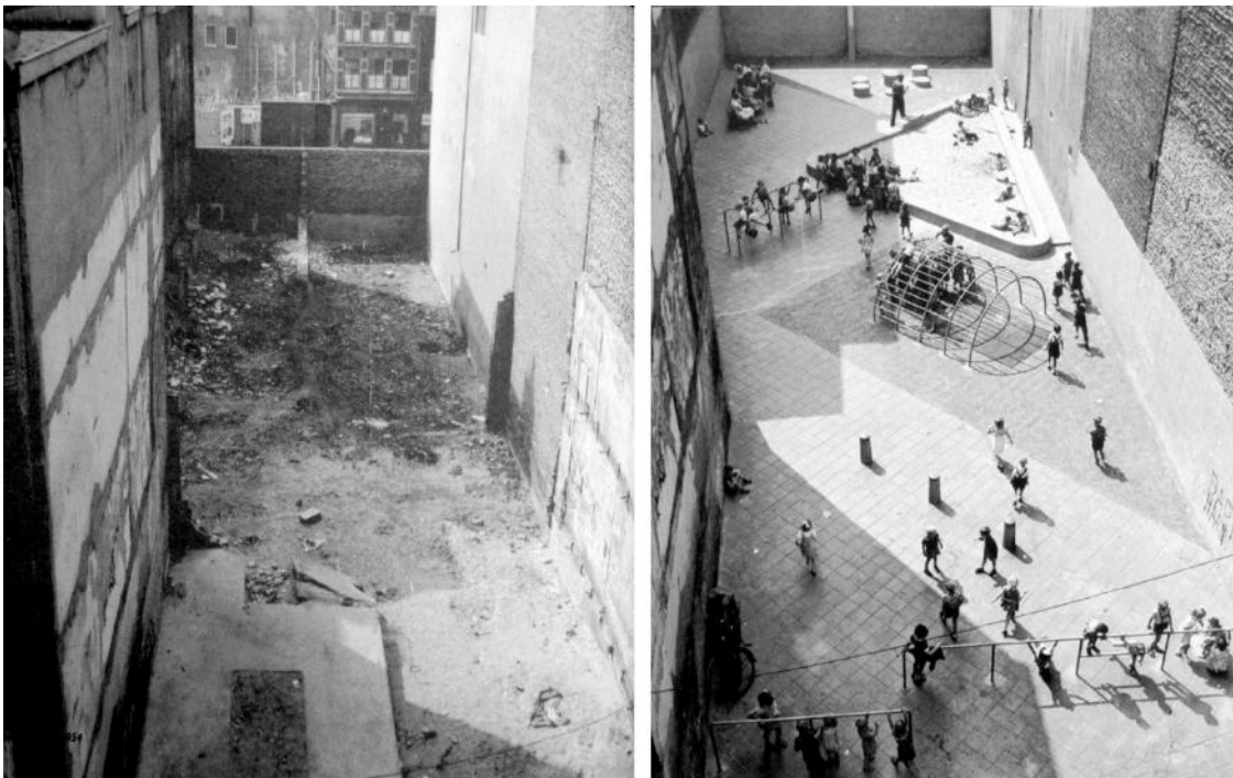
Imagen 2. A la izquierda, solar abandonado. A la derecha, solar tras la intervención.

Hay que decir que no somos un caso excepcional. Esta problemática ya ha tenido su respuesta en muchos otros lugares, y desde hace ya tiempo. Uno de los primeros ejemplos conocidos lo encontramos en los Playgrounds que se realizaron en Amsterdam tras la devastación de la Segunda Guerra Mundial, entre 1947 y 1971, por el Arquitecto Aldo Van Eyck. Su propuesta consistió en crear una red de "espacios de juego" reutilizando los espacios residuales de la ciudad, entre ellos solares abandonados. Con ello consiguió eliminar la insalubridad e inseguridad de estos espacios, aliviar la densidad de la trama urbana creciente de ese momento y mejorar la calidad de sus habitantes.