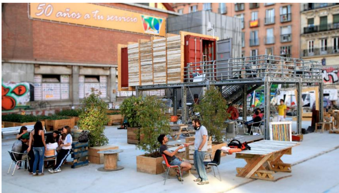
Imagen 4. Mobiliario y equipamiento diseñado para este espacio por vecinos y voluntarios.

En definitiva, un espacio destinado al abandono se ha convertido en un lugar donde converge la ciudad: talleres, teatros, cine, exposiciones, huertos urbanos, etc. Y además es un atractivo turístico cada vez más creciente para quienes visitan la ciudad.